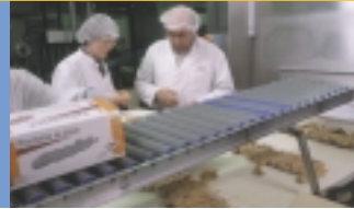
Cryo-Quick® Z van Air Products